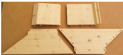
(beides Bilder von einem kleinen Muster-Futter)